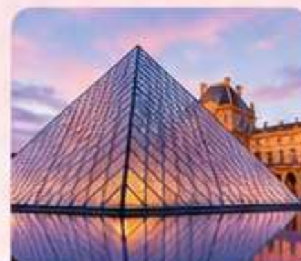
MUSEO DEL LOUVRE