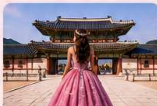
PALACIO GYEBOKGUNG Vestido tradicional hanbok