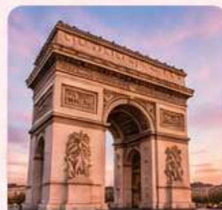
ARCO DEL TRIUNFO