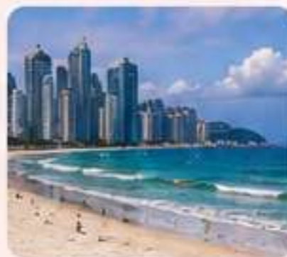
HAEUNDAE BEACH Playa y mar