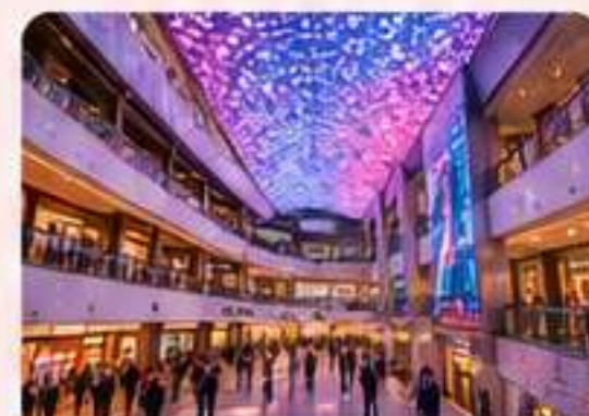
COEX STARFIELD Compras y entretenimiento