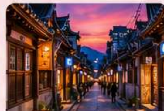
INSADONG Cultura y tradición