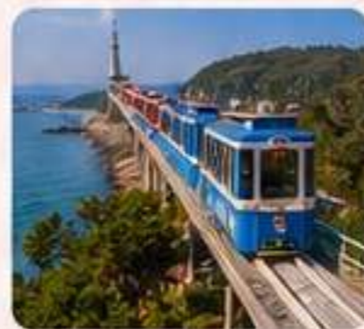
TREN PANORÁMICO Vistas espectaculares