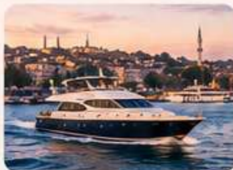
PASEO EN YATE POR EL BÓSFORO