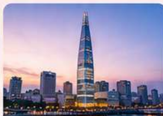
TORRE LOTTE Vistas increíbles