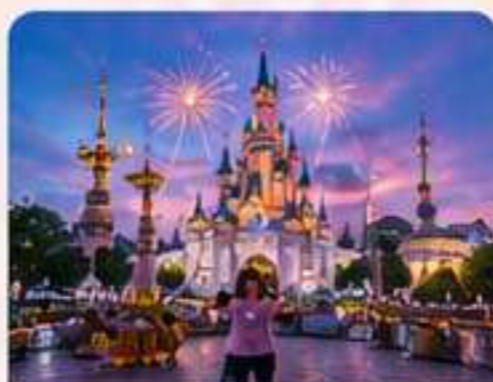
LOTTE WORLD Diversión sin límites