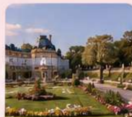
JARDINES DE LUXEMBURGO