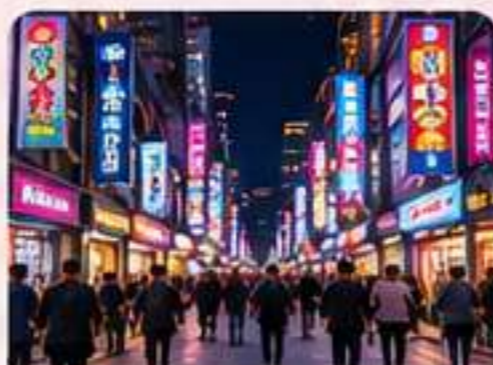
MYEONGDONG Zona de compras