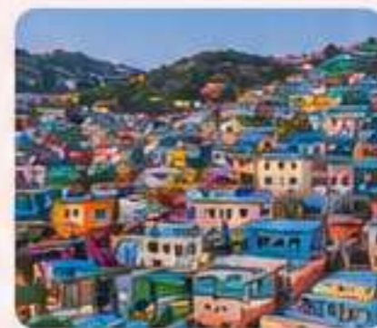
GAMCHEON CULTURE VILLAGE Arte y color